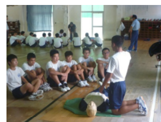
水難事故防止指導講話の様子